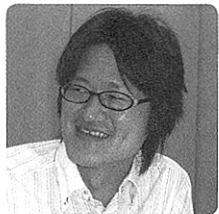
リンク at + link 事業部 マーケティング部